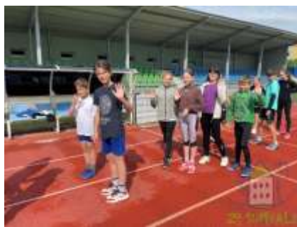
Okresní fotbalový turnaj v kopané 4. 4. 2022