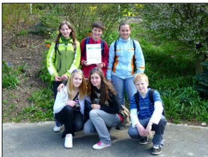
Zelená stezka – 1. místo (23.4.2010)