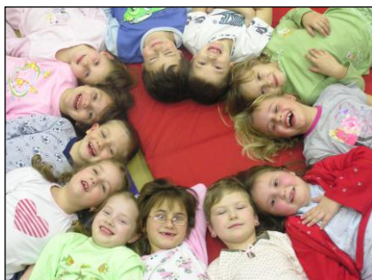
Nocování 1. tř. ve škole (6.1.2011)