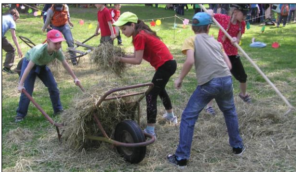
„Den Země“, 3.tř., Šumperk (29.4.2011)