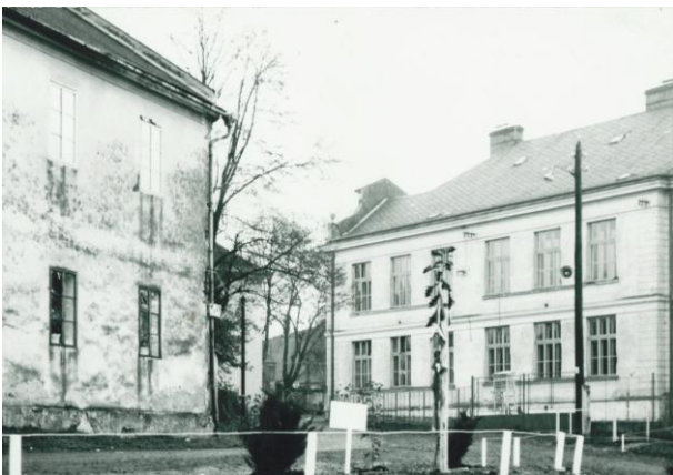
„Nová škola“ a fara, rok 1969

Těchto let bylo využito ke zlepšení prostředí ve stávajících budovách. Pro polytechnickou výchovu byly úpravou bývalého bytu získány místnosti pro pozatímní dílny. Pro tělesnou výchovu bylo velmi obtížné využívat kinosálu, proto byla zřízena nouzová cvičebna s nářadovnou z jedné třídy a přilehlého kabinetu. V hlavní budově byly přebudovány záchody na splachovací a do tříd zaveden vodovod. Staré zchátralé zídky a brány byly nahrazeny novými. Na dvoře byla zřízena nová panelová příjezdová cesta a složiště uhlí. Později byly přebudovány staré kůlny na