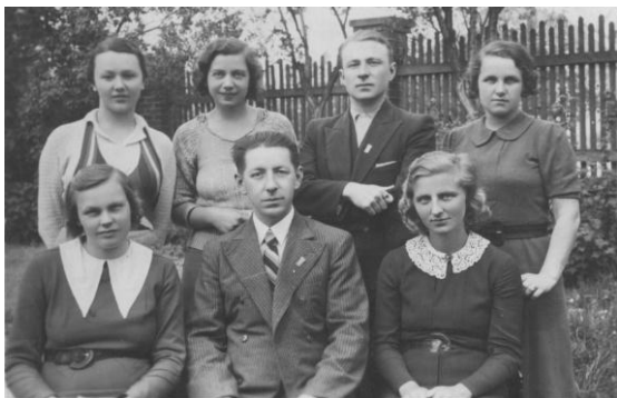
Fotografie učitelů, r.1937