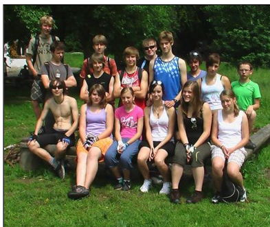
Sportovní kurz 9. tř. (červen 2011)