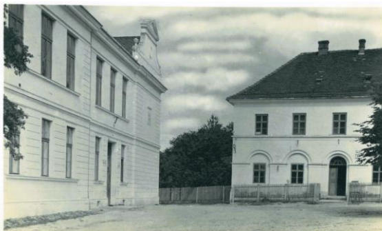
„Stará“ a „Nová“ škola, předválečná fotografie

slavnostně připevněna na školní budovu mramorová deska s nápisem "Škola - základ života", která tam je dodnes.