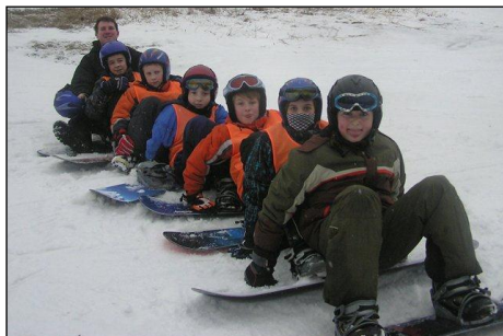
Lyžařský výcvik 6. - 7. třídy, Karlov p. Pradědem (únor 2011)