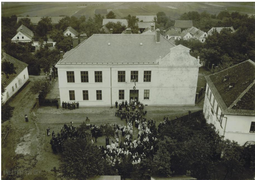
Svěcení školy 17. září 1911

Zamyslíme-li se nad skutečností, že se člověk dožije 100 let, je to pro nás obdivuhodné. Ale má-li budova školy 100 let, to nám připomene kronika, protože léta, která stojí na svém místě ubíhají a ona jen zevšední, někdy ztratí na své novotě, co se pokazí, to se spraví, vymění nebo dostaví. Musíme ale říci, že také žije. Co by to bylo za školu bez žáků, učitelů a všeho dění každý den.