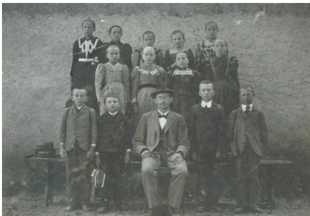
IV. třída r. 1901