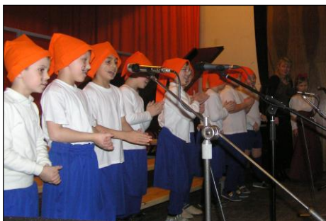
Vánoční koncert (12.12.2010)