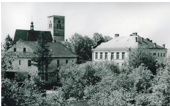
Známý pohled na školu, r. 1960

Obec Šumvald má v roce 2011 prostorný a plně funkční školní areál. Žáci, učitelé i provozní zaměstnanci mohou využívat ke své práci estetické a velmi dobře vybavené pracovní prostředí, plně srovnatelné s velkými městskými školami.