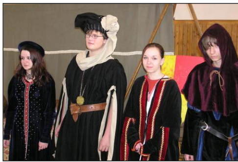
Středověk ve škole (10.3.2009)