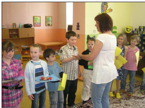
Recitační soutěž I. st. (18.5.2011)