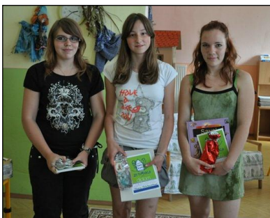
Literární soutěž (26.5.2011)