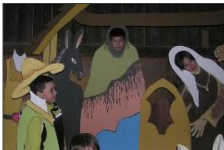
Výstava betlémů a „Oživlý betlém“ – Sokolský stadion (13. – 23.12.2010)