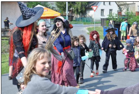
Slet čarodějnic (30.4.2011)