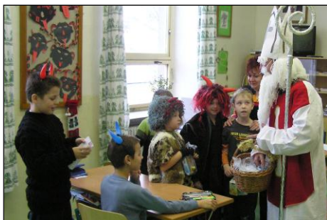
Mikuláš a čert ve škole (3.12.2010)