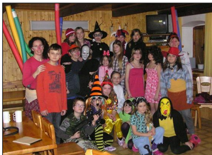
Zimní ozdravný pobyt 4. - 5. tř. (leden 2011)