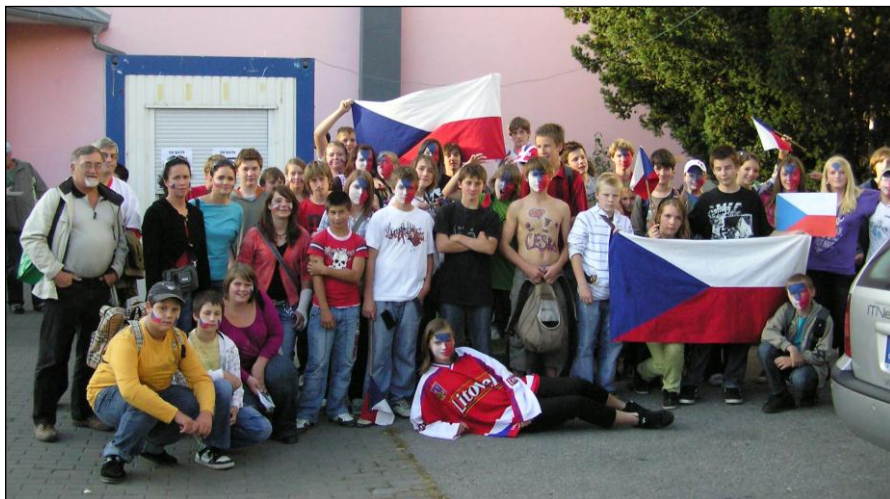
Mistrovství světa v basketbalu žen, Brno (23.9.2010)