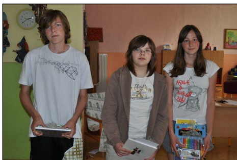
Výtvarná soutěž (26.5.2011)