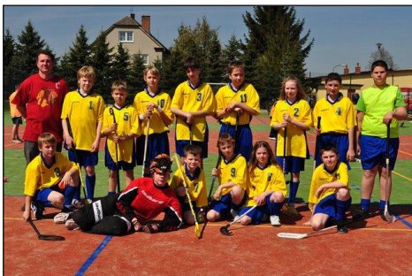
Florbalový turnaj (20.4.2011)