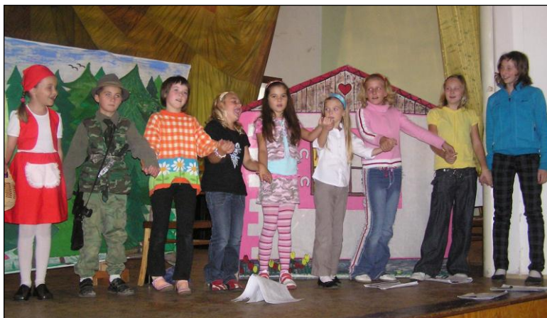
Vystoupení dětí na „Setkání důchodců“ (9.10.2009)