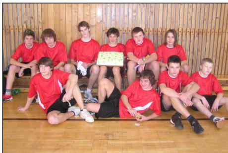
Vánoční turnaj v košíkové (15.12.2010) – 1. místo