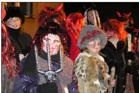
Čertíci – rozsvícení vánočního stromku (27.11.2010)