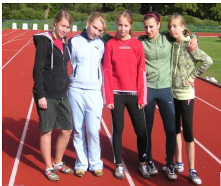
Atletický čtyřboj – Olomouc (28.9.2010)