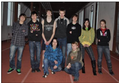
Běžec a skokan okresu (26.1.2011)