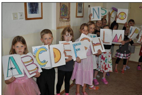
Prvňáčci rodičům (15.6.2011)